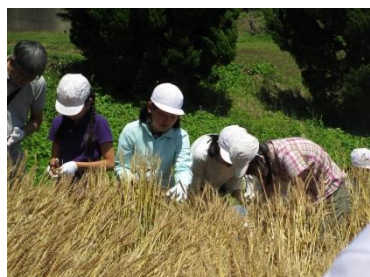
脱穀、製粉を経て秋に 小麦を調理します