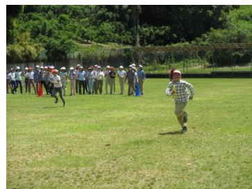
クラス対抗リレー