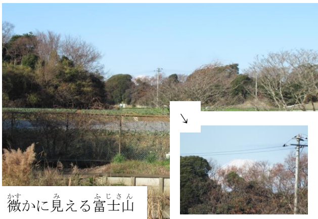
かすみに見える富士山