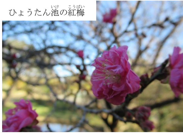
ひょうたん池の紅梅