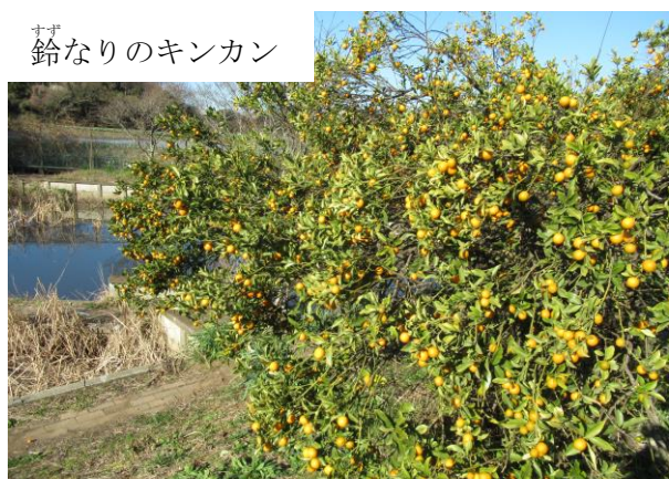
すず鈴なりのキンカン