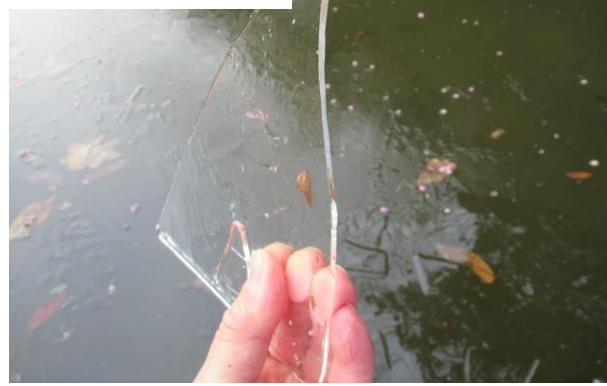
ひょうたん池の氷