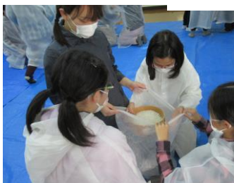
コムギを篩ってフスマ取り

6年生は、5年生の秋に種をまき、冬に麦踏も行い、年度をまたいでコムギを育ててきました。53号でお知らせしたように今年は大豊作で133号では、夏休み中の脱穀の作業を紹介しました。そして今回の秋合宿で、そのコムギを使って調理しました。グループごとにメニューを考え、挑戦するので昨日スーパーでコムギ以外の食材を買いだしてきました。また、製粉したコムギには茶色い皮の部分も含まれているので篩ってそのフスマも取りました。合宿2日目の今日の昼食にその小麦粉を使って調理の開始です。お好み焼き、ピザ、パンケーキ、ナン、パスタ、すいとん、餃子とコムギを使った様々な料理が完成していきました。自然教室で育てたコムギを自然教室で食べるまさに地産地消で小学校生活最後となる合宿を終えました。