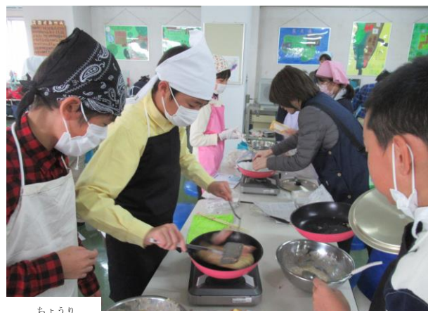
コムギを使って調理