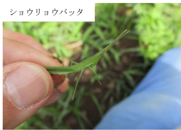
ショウリョウバッタ