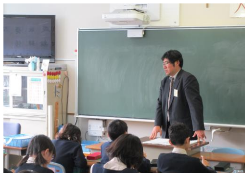
国語・「キャッチコピーを作ろう」