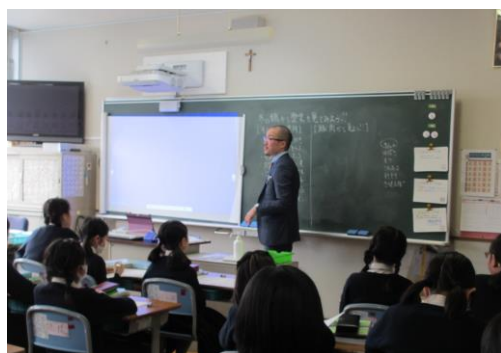
社会・「冬の鍋から見る歴史」

数学は「形の違うさいころをふってみよう」。実際にふって出た目の確率調べをしました。