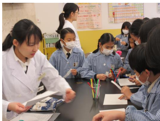
理科・「1つの色からたくさんの色を取り出そう」